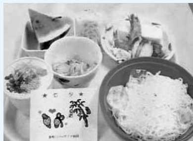
当院の七夕祭りの行事食