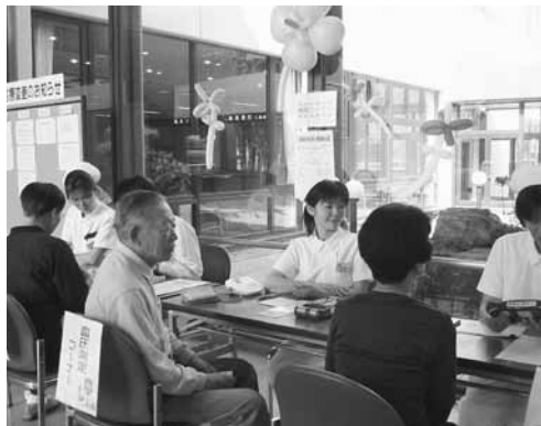
健康チェックはいかがでしたか？

病院の日・看護の日はお互いが「看護の心」「助け合いの心」をもつことが大切で、この心を育み、看護に対する理解を深めていただくためにと制定されました。