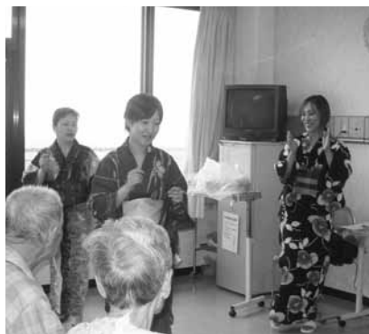
♪ササの葉、さらさら♪