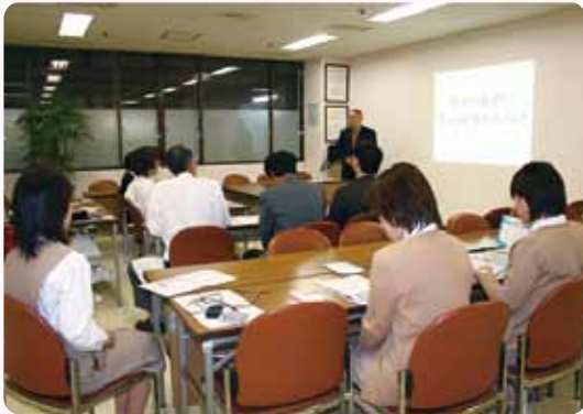
話を聞き終えて「お父さん禁煙するといいのに…」の声も