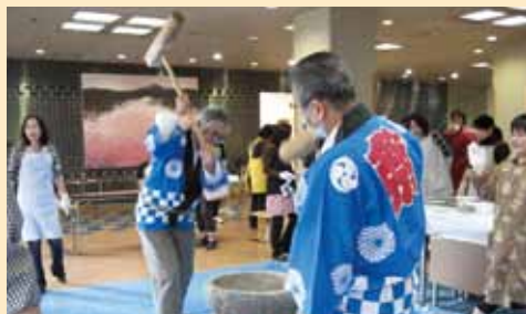
先生方のつくおもちも愛情いっぱい、元気でました！