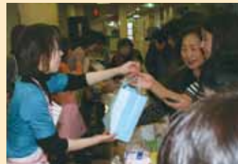
お買い上げありがとうございます