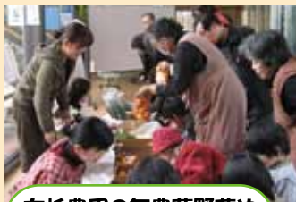
友杉農園の無農薬野菜や袋詰め放題のみかんも大好評でした